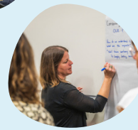
Vidéo des Dialogues sur la connaissance de l'océan