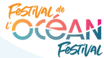
Vidéo de synthèse

ont assisté à une partie de ce festival en plein air de deux jours.